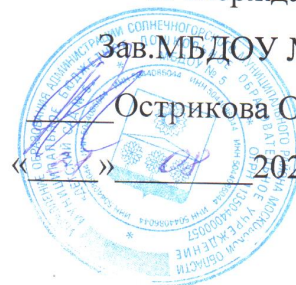
График работы педагога-психолога ДедухН.С.